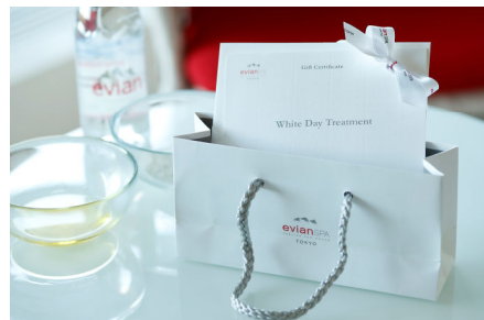
ホワイトデー トリートメントギフト券