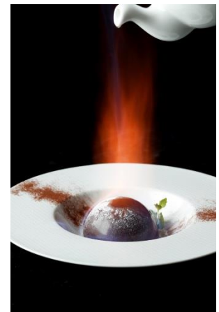
3種のベリーとチョコレートドームのデザートカクテル

ヴァニラアイス、ラズベリー、ブルーベリー、ストロベリーを盛り付け、チョコレートドームをかぶせました。火を点けたアルマニャックブランデーと、温かいチョコレートカクテルを同時に注ぎ入れてドームを溶かしながらいただく、サプライズ感溢れるカクテルです。