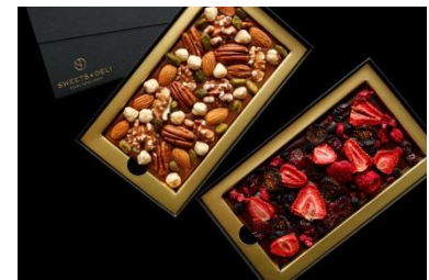
タブレット・ド・ショコラ

ナッツとドライフルーツをそれぞれふんだんに使用した贅沢なタブレット型ショコラ。ミルクチョコレートと香ばしいナッツのハーモニーを楽しめる「ノワ」と、ダークチョコレートとドライフルーツの程よい酸味が織りなす大人の味わい「フリュイ」の2種類をご用意いたしました。