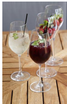
サングリア 赤・白