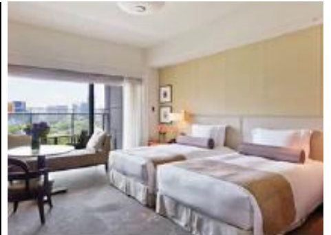
春限定宿泊プラン 「桜遊山～Blossoming Tokyo～」

パレスホテル東京(本社:東京都千代田区丸の内1-1-1、総支配人:渡部勝)では、2017年3月1日(水)～5月31日(水)の期間、色彩豊かな春の食材をふんだんに取り揃えた“春限定メニュー”や、爽やかな春の香りが広がる“春限定カクテル&シャンパン”をご提供いたします。また、2017年3月18日(土)～4月9日(日)の期間、満開の桜スポットをハイヤーで巡りプライベートツアーを満喫いただける“春限定宿泊プラン”をご提供いたします。