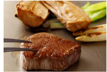
ランチコース「春風 -HARUKAZE-」

提供店舗 : 6F 鉄板焼「濠」 提供期間 : 2017年3月1日(水)～5月31日(水) 提供時間 : ランチ 11:30～14:30 ディナー 17:30～21:30(L.O) お問い合わせ : 03-3211-5322(日本料理「和田倉」と共通) メニュー / 料金 :