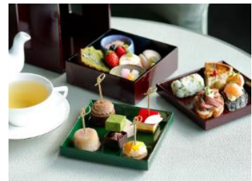
春のアフタヌーンティー

提供店舗 : 1F ロビーラウンジ「ザ パレス ラウンジ」 提供期間 : 2017年3月1日(水)～5月31日(水) 提供時間 : 13:00～16:30 ※土曜日・日曜日・祝日は 14:00 よりご提供 ※平日 13:00～15:00 のご来店にて、 アフタヌーンティーセットをご利用のお客様に限り お席のご予約を承ります。 お問い合わせ : 03-3211-5309 メニュー / 料金 :