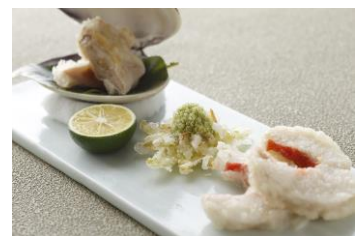
ディナーコース「さくら」

提供店舗 : 6F 天麩羅「巽」 提供期間 : 2017年3月1日(水)～5月31日(水) 提供時間 : ランチ 11:30～14:30 ディナー 17:30～21:30(L.O) お問い合わせ : 03-3211-5322(日本料理「和田倉」と共通)