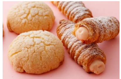
左)さくらのブリオッシュメロンパン 右)さくらクリーム・ホーン