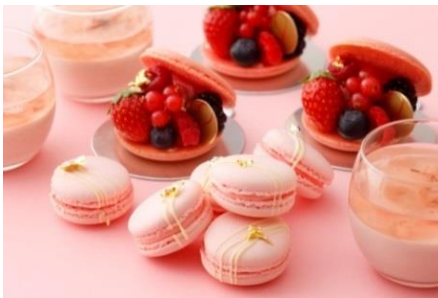
奥)さくら 手前)さくらまかろん 右)ペタル