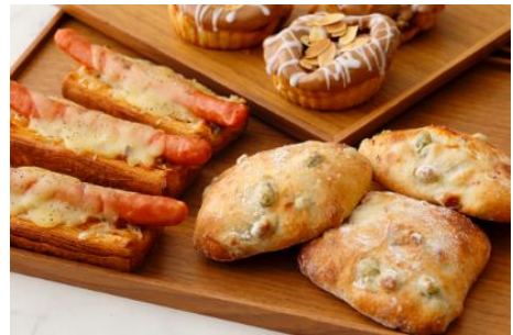
(右奥)シナモン・バンズ (左)ソーシソン (右)フェーブ