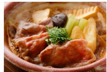
黒毛和牛のすき焼き膳

先附、花見弁当、ちらし寿司、椀、水菓子 ※提供期間:3月1日(水)～4月16日(日) ※ランチタイムのみのご提供となります。