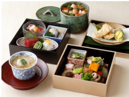
日本料理「和田倉」 花見弁当「麗 -HARUKA-」