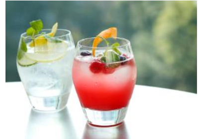
(左)フレッシュモヒートパンチ (右)ベリーサングリアパンチ

提供店舗 : 6F ラウンジバー「プリヴェ」 提供期間 : 2017年3月1日(水)～5月31日(水) 提供時間 : 11:30～24:00 お問い合わせ : 03-3211-5319