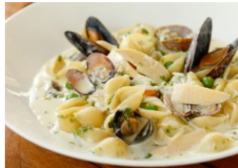
コンキリエパスタ 3種の貝と海藻のクリームソース グリンピース、筍 2,600円