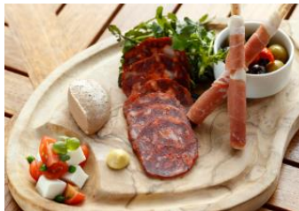
アソーテッドタパスプレート サンダニエーレプロシュート& ブラックペッパー風味のグリッシーニ イベリコ豚のチョリソ、鶏白レバーのムース モッツアレラとトマトのカプレーゼ 2色のオリーブとセミドライトマトのマリネ 2,800円