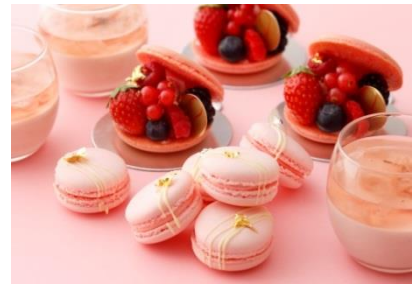
奥)さくら 手前)さくらまかろん 右)ペタル