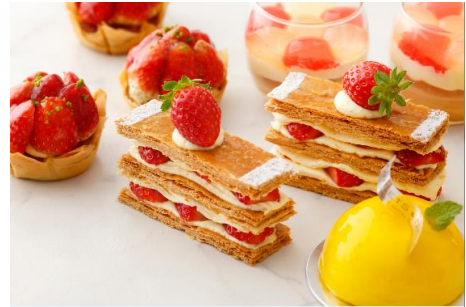
(右奥)ババ・オウ・アグリユーム (左奥)タルトレット・オウ・フレーズ (中)ミルフィーユ・オウ・フレーズ (右前)フロマージュ/アナナス