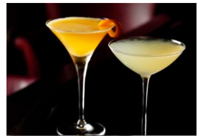
(左)甘夏のマティーニ (右)林檎のギムレット

提供店舗 : 1F メイン バー「ロイヤル バー」 提供期間 : 2017年3月1日(水)～5月31日(水) 提供時間 : 11:30～24:00 ※土曜日・日曜日・祝日は 17:00～24:00 お問い合わせ : 03-3211-5318