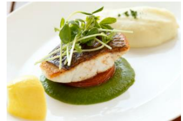
真鯛のプランチャ 菜の花と山葵のクーリ トマト、豆苗 3,500円