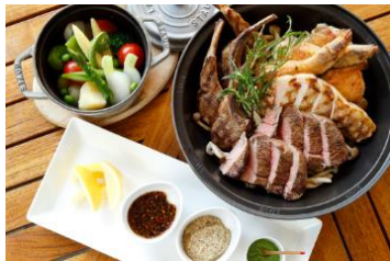
ミートコンボ ビーフテンダーロイン、チキンレッグ ラムチョップ、ポークロイン、季節野菜 ガーリックソイソース、グレインマスタード、抹茶塩、レモン (2名様)8,400円 (4名様)16,800円