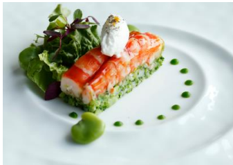
シュリンプと春野菜のプレッセ 菜の花と柚子のピューレ、レフォールクリーム 1,950円