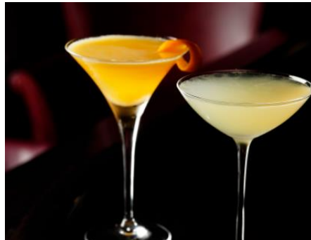
メイン バー「ロイヤル バー」 春のフレッシュフルーツ カクテル