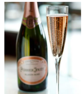
ペリエジュエ ブラゾンロゼ

グラス 2,600円 ボトル 15,000円 きめ細やかな泡が口の中に広がる、桜色に輝くシャンパン。