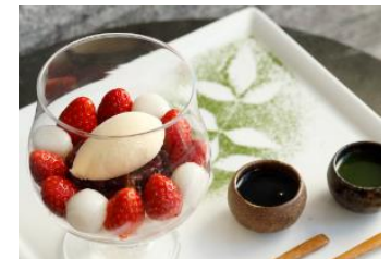
苺と白玉のあんみつ パンナコッタ、ヴァニラアイス 黒蜜、抹茶ソース 1,600円