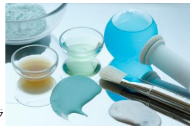
クリヨ-リポリス ボディ セラピー