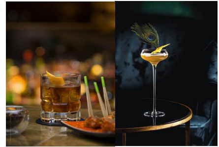
(左) Le Bristol Old Fashioned N° 1 (右) Cocktail 365

シャンパンにヴァンテージ・ブランデーとブリストルホテル特製ハニーを加え、シャンパンが本来持つ葡萄の旨味を立体的に表現したカクテル。さわやかな口当たりの中に感じる円熟味をお楽しみ下さい。