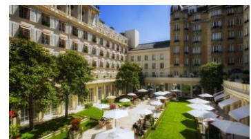
「ル・ブリストル・パリ」