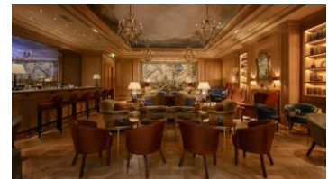
「ル・パール・デュ・ブリストル」店内