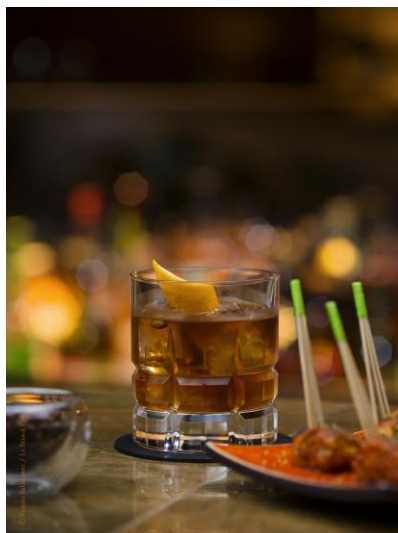
Le Bristol Old Fashioned N° 1