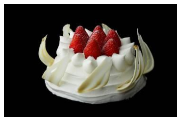
ストロベリー・ショートケーキ

粉雪をまとった華をイメージした、口当たりもやさしいショートケーキ。オリジナルブレンドの生クリームとイチゴをふんだんに使用。