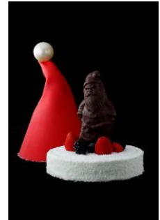
ボネ・ド・ペール・ノエル