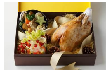
クリスマスギフト ローストチキン

販売期間:2015年12月20日(日)~25日(金)要予約 予約受付:12月1日(火)よりご購入日の4日前まで セット内容:大山鶏1羽(約1.8kg) 温野菜、ベジタブルスティック、ソース