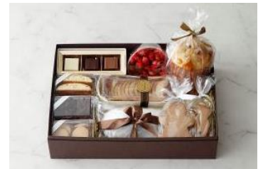
クリスマスハンパー

◆Christmas Hamper クリスマスハンパー 7,560円 販売期間:2015年12月5日(土)~25日(金)要予約 予約受付:12月1日(火)よりご購入日の4日前まで セット内容:シュトーレン、パネトーネ、ボンボンショコラ、ジンジャークッキー、アマンドロッシュ、サブレショコラ、サブレフロマージュ、ビスコッティ、ガトー・ボンム&テ