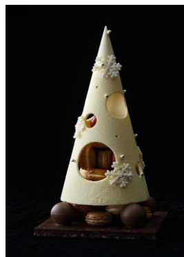
サパン・ド・ノエル