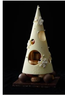
サパン・ド・ノエル

雪化粧をまとったかのように真っ白なホワイトチョコレートで作られたコーン型のツリーをあけると、中から彩り豊かなマカロンタワーが登場。パーティーにおすすめです。