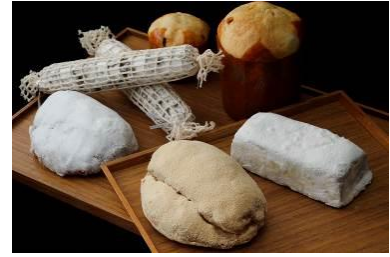
(右奥)パネトーネ (右前)シュバルツ・シュトーレン (左前)ボーネン・シュトーレン (左中)シュトーレン (左奥)ベラヴェッカ・アン・ソシソン

◆Panettone パネトーネ Large 9×H14cm 1,296円 / Small 6×H8.5cm 432円 キルシュに漬け込んだ6種のフルーツを使用した、しっとりとした口当たりのイタリア伝統のパン。