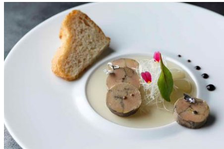
ヴァンデ産フォアグラカナルをシラー種の赤ワインで マーブル仕立てに 葡萄のジュレ オニオン風味のブリオッシュ・トーストを添えて 4,800円