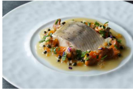
オープンで火入れたオムブルシュバリエ エシャロットコンフィのバターソース アプリコット ライムケッパー 菜園の花とハーブを添えて 6,000円