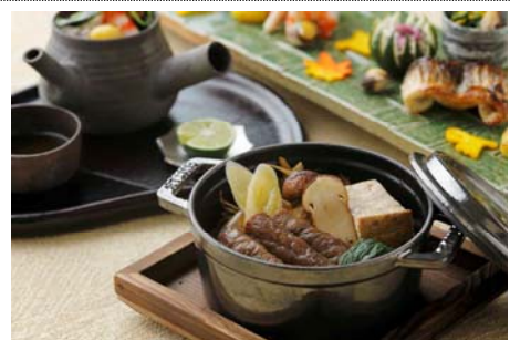
秋のおすすめ会席「和 -NAGOMI-」 21,600円

提供店舗 : 6F 日本料理「和田倉」 提供期間 : 2014年9月1日(月)～2014年11月30日(日) 提供時間 : ランチ 11:30～14:30 ディナー 17:30～22:00 お問い合わせ : 03-3211-5322