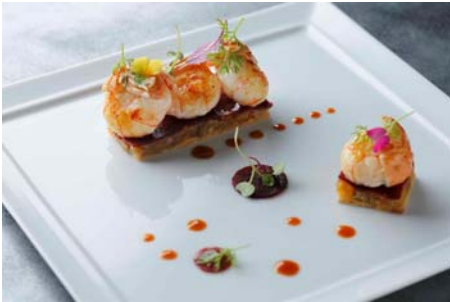
野菜のタルトレット ラングスティーヌのマリネ ベルガモットの風味 5,200円