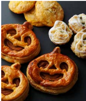
(左下)カボチャパイ