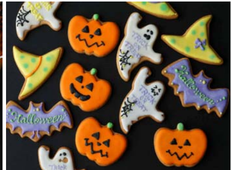
ハロウィン クッキー

パレスホテル東京（本社：東京都千代田区丸の内 1-1-1、総支配人：渡部勝）では、品のある味わいと美しいデザインのホテルメイドスイーツが並ぶペストリーショップ「Sweets & Deli」にて、秋の味覚を贅沢に使用したスイーツとパンをご提供いたします。こっくりとした濃厚な味わいのカボチャクリームとヴァニラの相性が絶妙な「カボチャのヴェリーヌ」、南瓜の種のアクセントがきいたエepis風味のカボチャのチーズケーキ「トリアングル」など、カボチャが織りなす多彩な魅力を味わえる秋季限定スイーツは、手土産にもおすすめです。