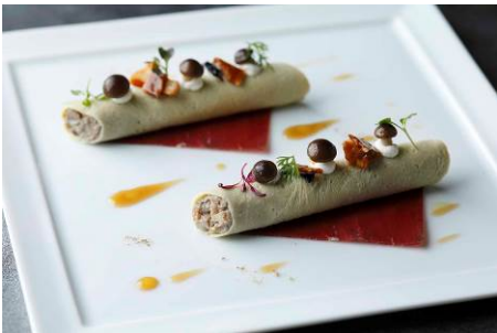
地鶏卵と茸ムース オムレット仕立て スモークビーフ はしばみのキャラメリゼ 4,400円