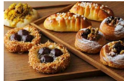
(左下)紅茶風味のマロンデニッシュ (右上)プチ・パタート・デュース (左上)キノコのフォカッチャ (右下)メープル風味のニダベイユ