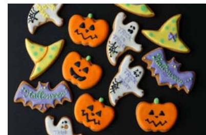
ハロウィン クッキー