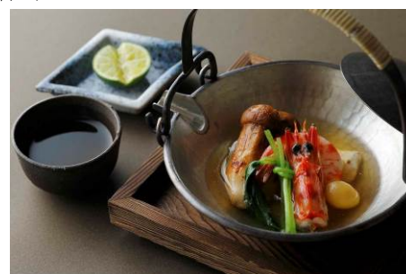
秋の味覚コース「濠 -REI-」 21,600 円

秋の味覚コース「濠 -REI-」 21,600 円 (全 8 品: 松茸の土瓶蒸し、スコットランド産ブルーオマールのサラダと鬼殻焼き含む)