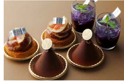
(右)巨峰とレモンバーベナーのゼリー (手前)シャテーニュ (左)タルト・オウ・フィグ