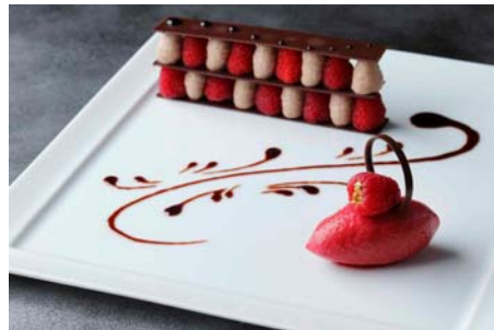
ショコラとフランボワーズのアリュメット エピスが香るシラーソースとともに 2,300円