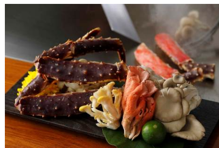
秋の味覚コース「湧水 -YUUSUI-」 8,700 円

提供店舗 : 6F 鉄板焼「濠」 提供期間 : 2014年9月1日(月)～2014年11月30日(日) 提供時間 : ランチ 11:30～14:30 ディナー 17:30～22:00 お問い合わせ : 03-3211-5322(日本料理「和田倉」と共通)