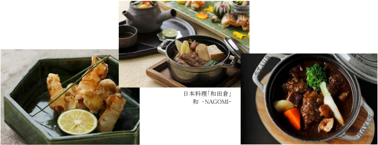
天麩羅「巽」ランチコース いちよう