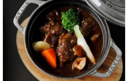
豚ホホ肉とポルチーニ茸の煮込み 季節野菜、赤ワイン 3,300円

提供店舗 : 1F オールデイダイニング「グランド キッチン」 提供期間 : 2014年9月1日(月)～2014年11月30日(日) 提供時間 : ブレックファースト 6:00～10:30 ランチコース 11:30～14:30 ディナーコース 17:30～22:00 お問い合わせ : 03-3211-5364