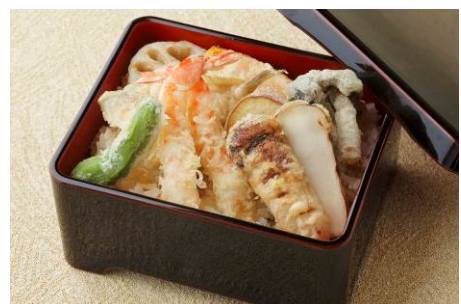
秋の特製天重 8,700円※ランチタイムのみ

メニュー / 料金 : ランチ 5,400円～ ディナー <平日> 14,000円～ <土日祝> 10,800円～