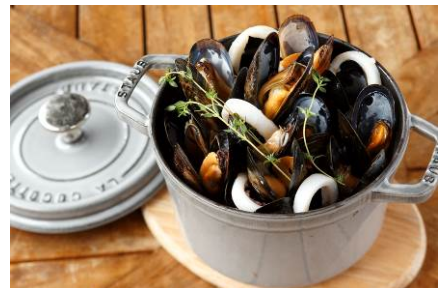
モンサンミッシェル産ムール貝と 白イカのワイン蒸しをココットで 2,600円

メニュー / 料金 : ブレックファースト 2,500円～ ランチコース 3,000円※平日のみ / 4,000円 / 5,800円 ディナーコース 3,900円 / 5,900円 / 6,900円