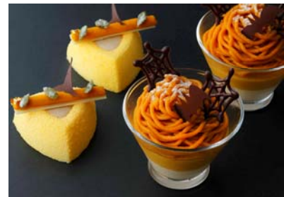
(左)トリアングル (右)カボチャのヴェリーヌ