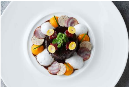
和牛ホホ肉をシラー種の赤ワインで柔らかくプレゼにして 2種のピーツキャロットのムーススリーヌ クミンとオレンジの香るエキューム 6,400円