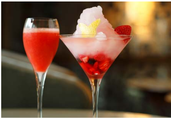
(左)桜苺、(右)雪解け果実