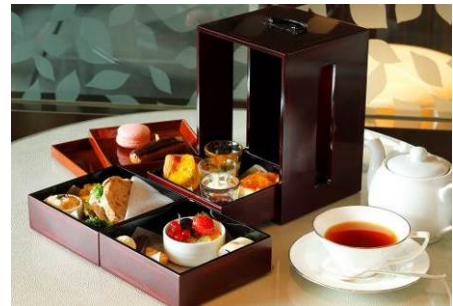
春のアフタヌーンティー

ジャンボンブランと菜の花のサンドイッチ、空豆・新玉ねぎ・ベーコンのキッシュ、新じゃがのクロメスキ、ピンチョス、コルニッション、セミドライフルーツ、山菜稲荷寿司、クランベリーのスコーン、デニッシュ、季節の和菓子、エクレア、フルーツ&ヨーグルトムース、ケーキオランジュ、オリジナル・ブレンド・ティー・セレクション