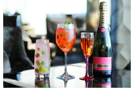
桜モヒート(左) ロゼ・シャンパンモヒート(中) パイパー・エドシック ロゼ・ソヴァージュ(右)

◆パイパー・エドシック ロゼ・ソヴァージュ グラス 2,400 円 ボトル 14,000 円