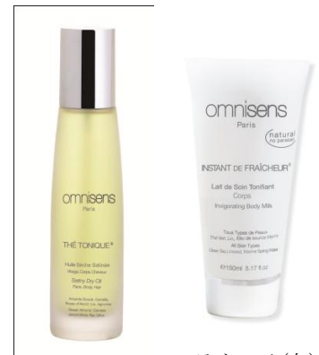
テ・トニック(左) アンスタン・ドゥ・フレッシュール(右)

軽やかでフレッシュなグリーンティーとベルガモットの香り。無着色、ノンパラベン、ノンシリコン、ミネラルオイル不使用で、高保湿でありながら、さっぱりと心地よい肌触りのボディクリーム。