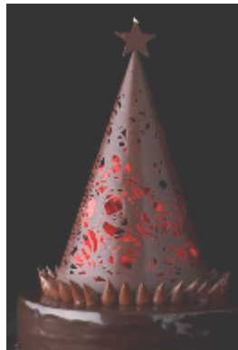
トゥール・デ・マカロン