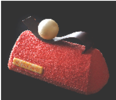
ブッシュ・ド・ノエル ヴァニラ/フリュイ・ルージュ