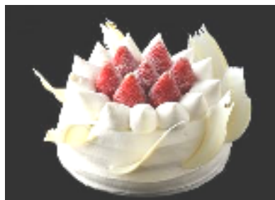
ストロベリー・ショートケーキ

白雪をまとった華をイメージした、口当たりもやさしいショートケーキ。ホイップクリームと大粒のイチゴをふんだんに使用したオーソドックスなショートケーキは、大人からお子様まで、幅広い層にお楽しみいただけます。