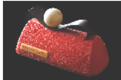
ブッシュ・ド・ノエル ヴァニラ / フリュイ・ルージュ

風味豊かな赤い果実のゼリーを、ロどけのよいヴァニラムースで包み込み、クリスマスらしい深みのある赤いチョコレートで仕上げました。ホワイトパールをイメージしたチョコレートがアクセントに飾られた、シックなデザインのケーキです。