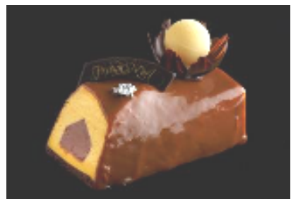
ブッシュ・ド・ノエル キャラメル/マンゴー/ショコラ

チョコレートとマンゴーの2層のムースを、香ばしいキャラメルでコーティングした、ブッシュ・ド・ノエル。しっとりした口当たりの良いマンゴームースと、キャラメルの苦味が絶妙です。