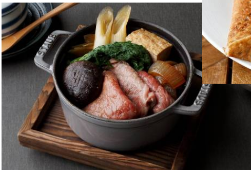
日本料理「和田倉」佐賀県産 黒毛和牛のすき煮