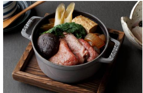
佐賀県産 黒毛和牛のすき煮 8,400 円 (ランチタイムのみ) *数量限定

メニュー / 料金 :ランチ 5,250 円～ ディナー <平日>13,650 円～ <土日祝>10,500 円～