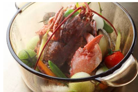
秋の味覚コース「濠-れい-」 ブルーオマールのココット蒸し

メニュー / 料金 :秋の味覚ランチ「湧水 -ゆうすい-」 10,500円 (全9品:茸のスープ、巻海老のカダイフ巻とカマスの照り焼き含む) 秋の味覚コース「濠-れい-」 21,000円 (全11品:秋茄子と国産鴨胸肉の朴葉包み焼き含む) 松茸の一本焼(9/1～10/31まで提供)