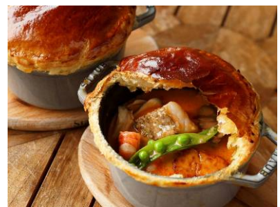
本日の鮮魚、ブラックタイガー、帆立貝のポットパイ 白インゲン豆と甲殻類のソースとともに 3,200円