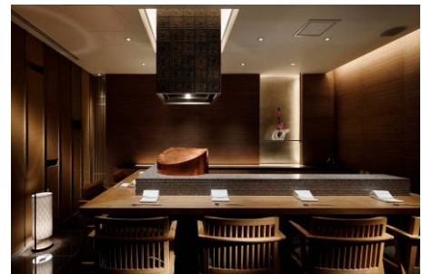
天麩羅「巽」カウンター