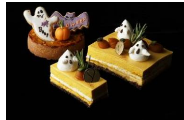
タルト・ポティロン(上) シナモン風味のカボチャムース(下)