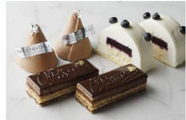
フロマージュ・ミルティーク(右上) オペラ(左上) モンブラン(左)