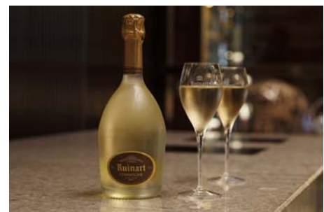
ルイナール ブラン・ド・ブラン

提供店舗 : 1F ロビーラウンジ「ザ パレス ラウンジ」 提供時間 : 10:00～24:00 ※金曜日・祝前日(平日のみ)は25:00まで お問い合わせ : 03-3211-5309