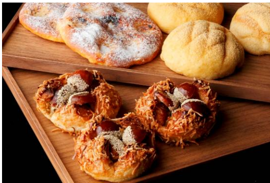
キノコとじゃがいものフォカッチャ(左上) きな粉のメロンパン(右上) 紅茶とマロンのデニッシュ(手前)