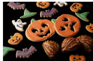
ハロウィンクッキー