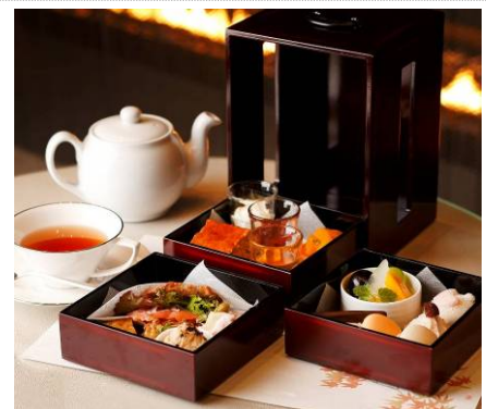
オータムアフタヌーンティー