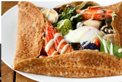
オールデイダイニング 「グランド キッチン」 そば粉のガレット