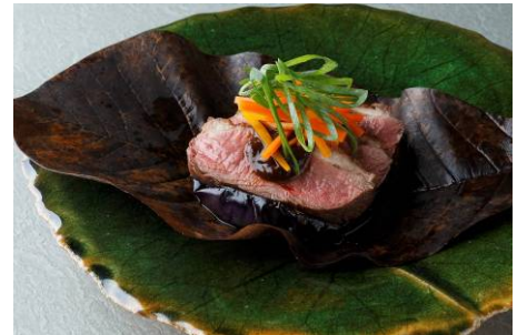
秋の味覚コース「濠-れい-」 秋茄子と国産鴨胸肉の朴葉包み焼き

提供店舗 :6F 鉄板焼「濠」 提供期間 :2013年9月1日(日)～2013年11月30日(土) 提供時間 :ランチ 11:30～14:30 ディナー 17:30～22:00 お問い合わせ :03-3211-5322(日本料理「和田倉」と共通)