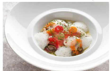
金目鯛を優しく火入れをして 透明な柚子のジュレと秋の茸 ムッシュボルディエの海藻入り ブルブランソース 5,800円