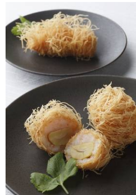
蝦のすり身と蟹味噌入りカダイフ巻き(2個)873円(写真上) 蝦のすり身と栗入りのカダイフ巻き(2個)728円(写真下)

*上海蟹コースの提供は、9月下旬を予定しております。 状況により変更となる場合もございますので、予めご了承ください。