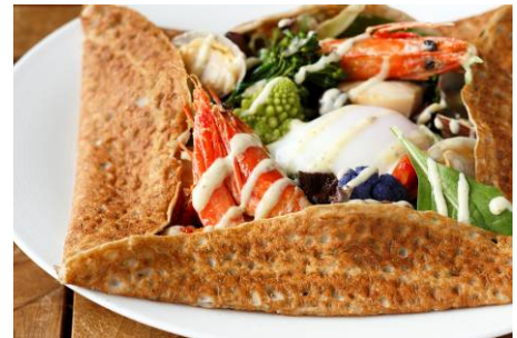
そば粉のガレット 天使の海老、帆立貝、旬の野菜 温泉卵、アイオリソース 1,800円

メニュー / 料金 : ブレックファースト 2,500円～ ランチコース 2,900円 / 3,800円 ディナーコース 3,500円 / 5,500円 / 6,500円