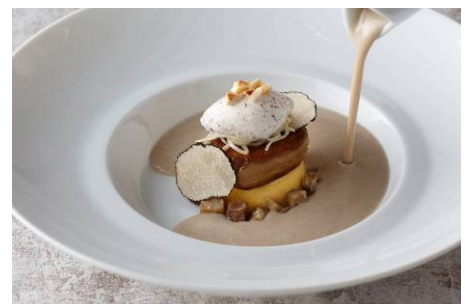
鴨フォアグラのモワルーとシャティニーニュのヴルーテ グリュエ・ド・カカオのクレーム ノワゼットのロースト 4,200円

メニュー / 料金 : ランチコース 6,300円～ ディナーコース 12,600円～