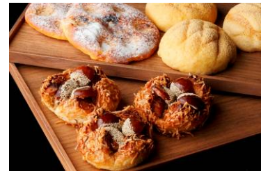
キノコとじゃがいものフォカッチャ(左) きな粉のメロンパン(右) 紅茶とマロンのデニッシュ(手前)