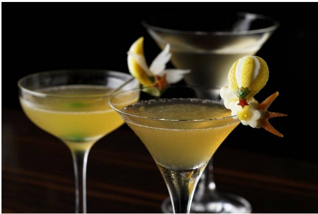
(写真手前より) パローネ、ブルマージュ、ウイステリア