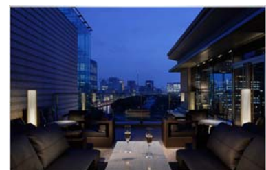
プリヴェ テラス席