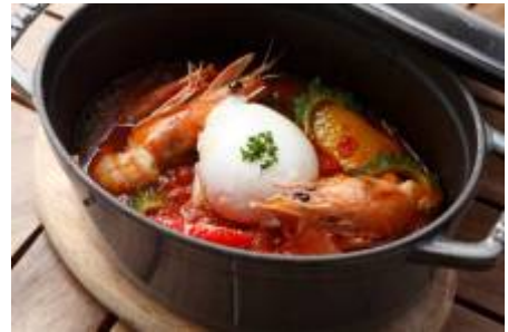
大山鶏と天使の海老のトマト煮 温泉卵のマレンゴ風 3,200円