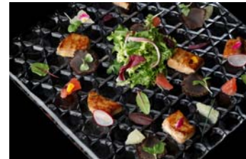
フレッシュフォアグラのサラダ