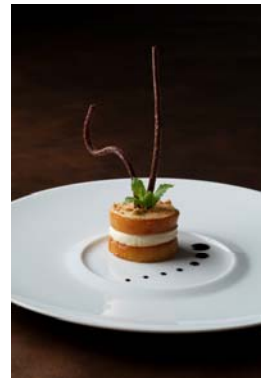
もみの木の蜂蜜でコンフィしたリンゴのクロカン カルバドス風味のヴァニラパフェのミルフィーユ