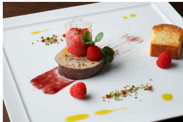
6F フランス料理「クラウン」 ヴァンデ産鴨フォアグラ 赤ワインのエピスでマーブル模様 にフランボワーズのエスプーマをクリスタルのチューブに詰めて 自家製プリオッシュのトースト