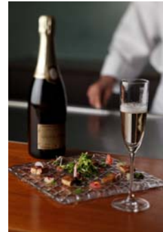
「濠」クリスマスコース