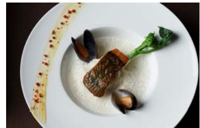
ヒラメのマリニエール