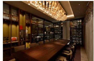
「グランド キッチン」個室