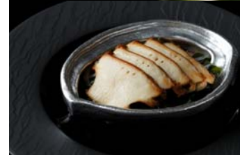
焼きたらばがに、 鮑の磯蒸し

＜パレスホテル東京に関する一般の方からのお問合せ/ご掲載用お問合せ＞ パレスホテル東京