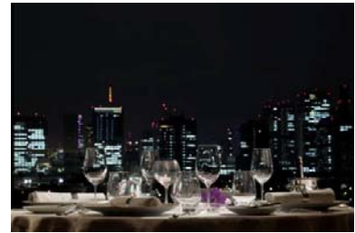
「クラウン」からの夜景

旧パレスホテル時代から続く、1964年創業のフランス料理店。フランス料理界の巨匠アラン・シャペルやポール・ボキューズを輩出したフランス・ヴィエンヌの名店「ラ・ピラミッド」監修による、オリジナルメニューを展開しています。食通達が愛してやまないパレスホテルの伝統を継承しつつも、フランス現地の流行やアイデアを取り入れた新たな感性で創り上げる、至高の「キュイジーヌ・モダン」のお料理をお楽しみいただけます。