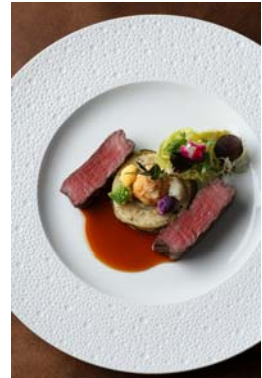
特選銘柄黒毛和牛 網焼きにして ロングマカロニとクルジェットのグラチネ トリュフ風味 カリフラワーのヴァリエとプティサラダと共に コニャックとマデラ酒のソース