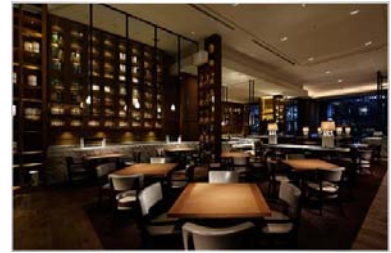
「グランド キッチン」店内

人気のココット料理は、「オマール海老のココット蒸し焼き」としてご提供いたします。デザートには、りんごの甘い香りに包まれた「タルトタタン ヴァニラアイスクリーム添え」をご用意し、楽しく賑やかなクリスマスをお届けいたします。