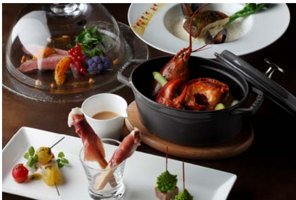
1F オールデイダイニング「グランド キッチン」 クリスマスメニュー