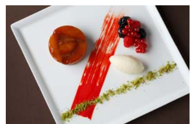
タルトタタン ヴァニラアイスクリーム添え