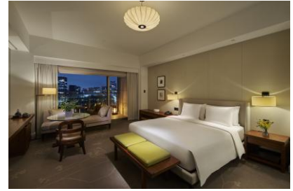
デラックスキング with バルコニー

※上記料金は2泊3日分の1室料金です(消費税込)。 ※別途、サービス料 15%、東京都宿泊税を頂戴いたします。 ※ご予約はチェックイン 14 日前まで承ります。 ※1 日 1 室(1～3 名様利用)限定販売とさせていただきます。