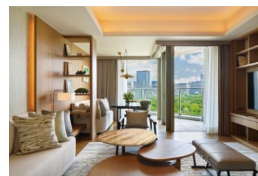
プレミアスイート