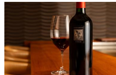
スクリーミング イーグル イメージ