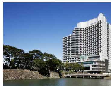
パレスホテル東京 外観

都心にありながら豊かな自然に囲まれたパレスホテル東京は、前身の「パレスホテル」として1961年に開業し、2012年5月17日に新生「パレスホテル東京」としてグランドオープン。「美しい国の、美しい一日がある。」をブランドコンセプトに丸の内1-1-1に位置するホテルならではの「最上質の日本」をお客様に提供していくことを目指しています。「フォーブス・トラベルガイド」ホテル部門にて日系ホテルとして初めて5つ星を獲得し、2016年以降11年連続で維持しています。2025年にはミシュランガイドのホテルセレクションにおける新たな評価「ミシュランキー」にて、最高評価である3ミシュランキーに2年連続で選出されました。