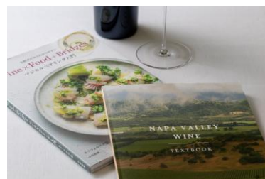
特別アメニティ イメージ