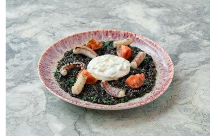
イカ墨のリゾット ブッラータチーズ添え