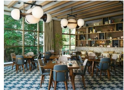
「UPSTAIRZ Lounge, Bar, Restaurant」

ブレックファストからディナーまでご利用いただけるダイニングに、アフタヌーンティーやカクテルをお楽しみいただけるバーラウンジが併設されたスタイリッシュな空間です。デザイン性の高いバーカウンターでは、バーテンダーが考案したオリジナルカクテルから、希少価値の高いジャパニーズウイスキーまで、バーテンダーがお客様のご希望に合わせたお気に入りの一杯をご用意いたします。また個室やテラス席も備えており、様々なシーンや用途でお使いいただけます。大阪の食文化に敬意を払い、五感に響く料理の数々を提供しております。