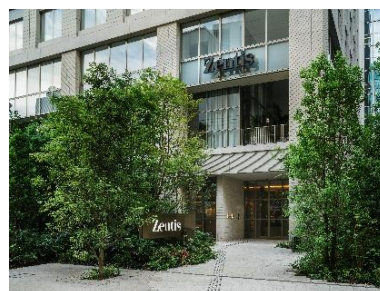
Zentis Osaka 外観