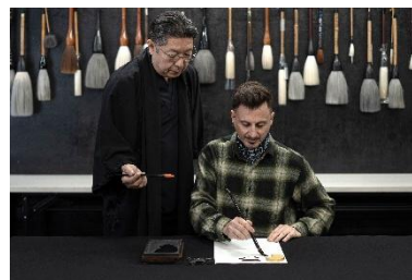
レッスンイメージ

Zentis Osaka にご宿泊のお客様のために、日本の伝統文化に触れる館外アクティビティをご用意いたします。現代で忘れ去られつつある「筆で文字を書く」という文化体験を通じて、ゆっくりと自分と向き合い新たなインスピレーションを養う機会を創出いたします。「Encounters of a New Kind 感性が、深呼吸する場所。」をブランドコンセプトに掲げるホテルがご提供する特別なアクティビティをお楽しみください。