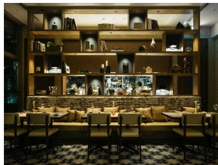
UPSTAIRZ Lounge, Bar, Restaurant