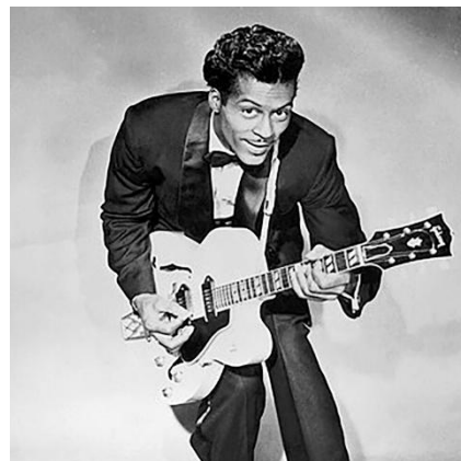
チャック・ベリー氏

アメリカ合衆国・ミズーリ州出身。ロックンロール創始者の代表格であり、ポピュラー・ミュージックに絶大な影響を与えたチャック・ベリー氏は、1950年代にギター主導のビートとストーリーテリング的な歌詞を融合させ、ロックンロールの原型を作り上げました。メロディのみならず若者の共感を呼ぶ歌詞が、それまでの音楽とは一線を画し、若者中心の大衆音楽という新しい潮流を築き上げました。当時のアメリカでは、黒人アーティストがラジオや白人観客の前で演奏することは困難でしたが、同氏は人種の壁を越えて人気を博した初の黒人ロックンローラーです。ビートルズ、ローリング・ストーンズ、ジミ・ヘンドリックス、ブルース・スプリングスティーンなど、多数のレジェンドアーティストが同氏の曲をカバーし、影響を受けたと公言しています。代表作「ジョニー・B・グッド」は、1977年にアメリカ航空宇宙局（NASA）の宇宙探査機〈ボイジャー1号〉に搭載されたゴールデンレコードに収録され、人類の文化の象徴として宇宙へと旅立ちました。