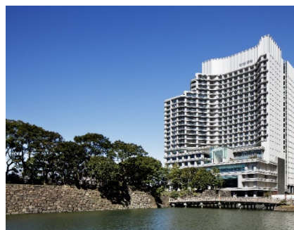
パレスホテル東京 外観

都心にありながら豊かな自然に囲まれたパレスホテル東京は、前身の「パレスホテル」として 1961 年に開業し、2012 年 5 月 17 日に新生「パレスホテル東京」としてグランドオープン。「美しい国の、美しい一日がある。」をブランドコンセプトに、「自然との調和」、「グローバルベスト」、「五感クオリティ」、「究極のパーソナルタイム」、「真心のおもてなし」の 5 つの提供価値を掲げ、丸の内 1-1-1 に位置するホテルならではの「最上質の日本」をお客様に提供していくことを目指しています。「フォーブス・トラベルガイド」ホテル部門にて日系ホテルとして初めて 5 つ星を獲得し、2016 年以降 10 年連続で維持しています。2024 年にはミシュランガイドのホテルセレクションにおける新たな評価「ミシュランキー」にて、最高評価である 3 ミシュランキーに選出されました。