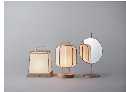
Time & Style (左より) 「andon - 012」、「andon - 022」、「Amaterasu」