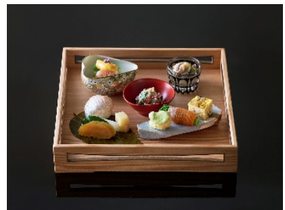
日本料理 和田倉 会席コース内八寸