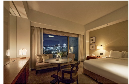
デラックスキング with バルコニー

※上記料金は2泊3日分の1室料金です(サービス料15%、消費税込)。 ※別途、東京都宿泊税1名様につき200円/泊を頂戴いたします。 ※ご予約はチェックイン20日前まで承ります。 ※1日1室(1~3名様利用)限定販売とさせていただきます。 ※1泊2日のプランもございます。 ※クラブルームの販売もございます。