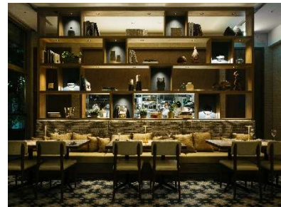
UPSTAIRZ Lounge, Bar, Restaurant