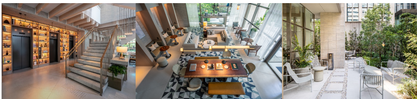
ロビー 正面には2階へ続く階段