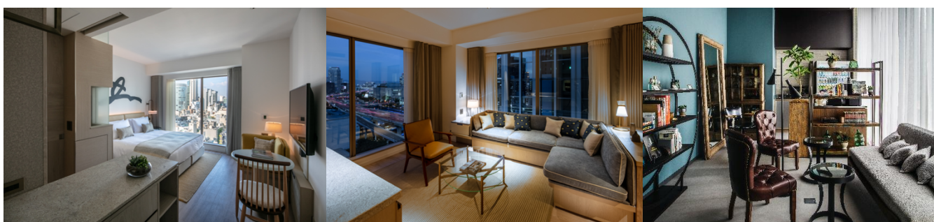
必要な機能がそろう客室 Studio (25㎡)