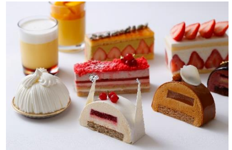
「パレスホテル東京スイーツブティック」販売ケーキ イメージ

*最新情報は、公式 Instagram ( パレスホテル東京/オンラインショップ )にて発信しております