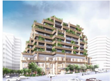
「Forestgate Daikanyama」MAIN棟 パースイメージ