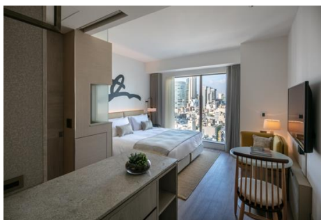
必要な機能がそろった客室 Studio (25㎡)