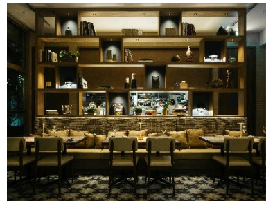
「UPSTAIRZ Lounge, Bar, Restaurant」