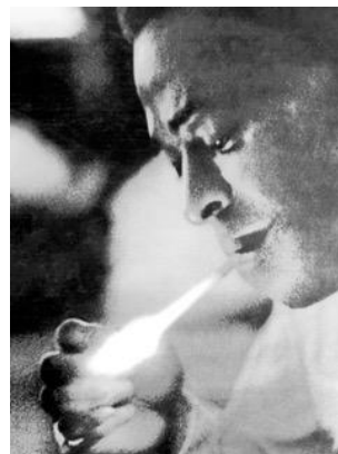
Miles Davis 氏

米国のトランペット奏者。モダン・ジャズの歴史を築き上げ、「ジャズの帝王」として広く知られています。音楽に造詣が深い両親のもとに生まれたマイルス・デイヴィスは、世界屈指の音楽大学と名高いジュリアード音楽院で音楽を学びました。「ビバップ (モダン・ジャズの始まり) の父」であるアルト・サクソ奏者、チャーリー・パーカーとの共演を経て、本格的にジャズの世界へ。ブルースやロック、ヒップホップなど、様々なジャンルに注目しており、音楽に対して非常に柔軟で先進的な姿勢を見せています。「ソー・ホワット (So What)」など数々のヒット曲を生み出した同氏は、グラミー賞を通算 8 回受賞し、さらには 11 枚ものアルバムでグラミー殿堂賞を受賞しています。アルバム「カインド・オブ・ブルー (Kind of Blue)」は、全世界で累計 1000 万枚を超える売り上げを達成し、現代でも名盤と呼ばれています。