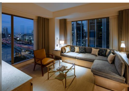
大阪の街が一望できる Suite (57㎡)