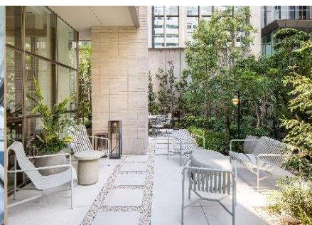
緑に囲まれた1Fのガーデン