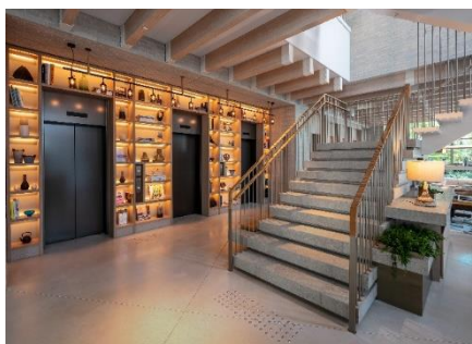
ロビー 正面には2階へ続く階段