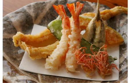
ランチコース「つばき」8,400 円 (天麩羅 8 品: 鱈の白子含む)