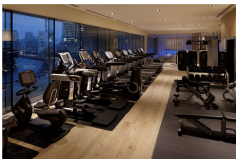
エビアン スパ 東京 フィットネスルーム