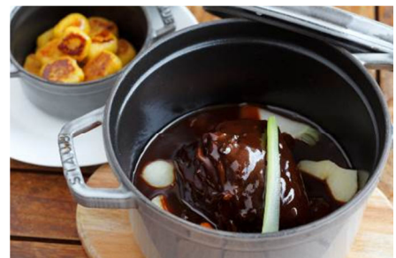
エゾ鹿の赤ワイン煮込み カボチャのニョッキを添えて 3,400円