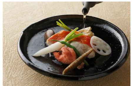
ランチコース「碧水」8,400 円 (全 8 品: 旬の魚介と根菜の和風スープ仕立て含む)