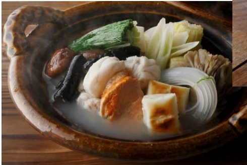
日本料理「和田倉」 鮫鱈鍋コース ※写真は2人前