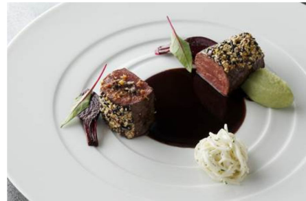
天然狩猟 エゾ鹿のロースト セリアルのクルートにオレンジの香りを添えて セロリラヴのピュレとジュリエヌ カカオとカルダモンのジュ 7,200円

メニュー / 料金 :ランチコース 6,300円～ ディナーコース 12,600円～