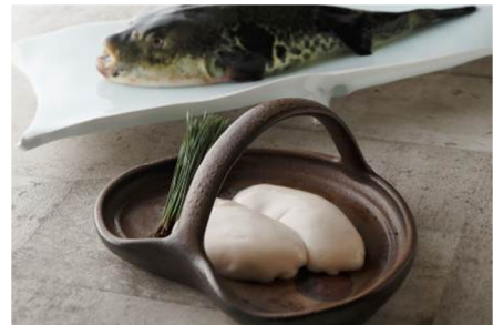
河豚ディナーコース 26,250円 ※イメージ

メニュー / 料金 :ランチ 5,250円～ ディナー <平日> 13,650円～ <土日祝> 10,500円～