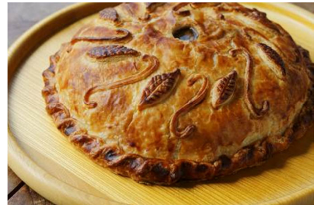
仔牛肉、豚レバーとシャンピニオンのパテ・アンクルート(1カット) 1,800円

提供店舗 :1F オールデイダイニング「グランド キッチン」 提供期間 :2013年12月1日(日)～2014年2月28日(金) 提供時間 :ブレイクファースト 6:00～10:30 ランチコース 11:30～14:30 ディナーコース 17:30～22:00 お問い合わせ :03-3211-5364