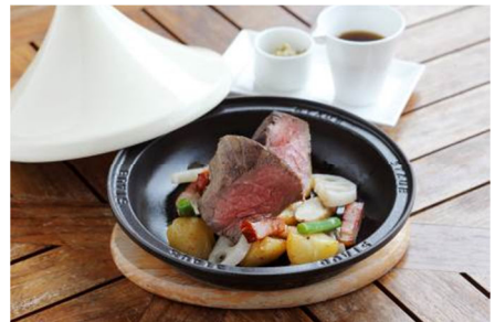
国産牛モモ肉のロースト グレイビーと柚子胡椒味噌をあわせて 3,600円