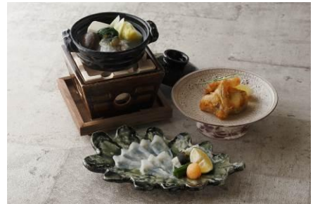
河豚ランチコース

メニュー / 料金 : 鮫鱈鍋コース 16,800 円 (前菜、お造り、鮫鱈鍋、酢の物、食事、水菓子) ※ご利用の3日前までにご予約ください。 ※ディナータイムのみのご提供となります。 河豚ランチコース 10,500 円 (鉄刺、唐揚げ、小鍋、食事、水菓子) ※数に限りがございますので、あらかじめご了承ください。 河豚ディナーコース 26,250 円 (前菜、鉄刺、唐揚げ、ちり鍋、食事、水菓子) ※ご利用の3日前までにご予約ください。