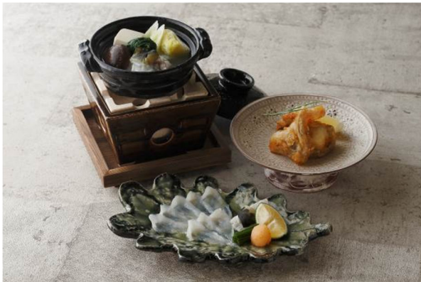
日本料理「和田倉」 河豚ランチコース