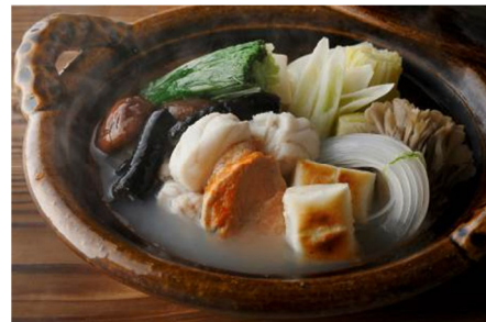
鮫鱈鍋コース 16,800円(ディナータイム限定) ※写真は2人前

提供店舗 :6F 日本料理「和田倉」 提供期間 :2013年12月1日(日)～2014年2月28日(金) 提供時間 :ランチ 11:30～14:30 ディナー 17:30～22:00 お問い合わせ :03-3211-5322