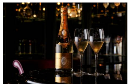
ルイ・ロデレール・クリスタル・ブリュット

メニュー / 料金 : レミー・マルタン・ルイ13世 テイスティングショット 9,000円 ワンショット 18,000円 ボトル 360,000円 ルイ・ロデレール・クリスタル・ブリュット グラス 3,300円 / ボトル 29,000円