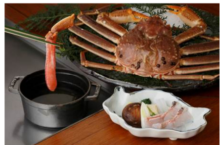
ディナーコース「洗」21,000 円 (全 8 品: 鮮魚とズワイ蟹のしゃぶしゃぶ、白子の鉄板焼含む)