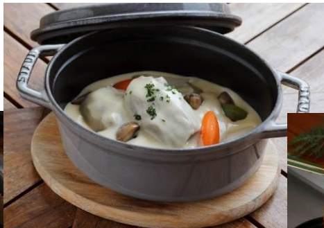
オールデイダイニング 「グランド キッチン」 仔牛肉と季節野菜の煮込み フォアグラバターを加えて