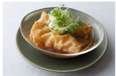
五目入り湯葉巻き 干し鮑出汁ソース仕立て(2本)800円

メニュー / 料理 : ランチコース 6,000円～ (名物北京ダック含む全7品) ディナーコース 12,000円～ (名物北京ダック含む全9品) *いずれのコースも2名様より承ります。