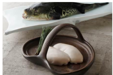
河豚ディナーコース ※イメージ