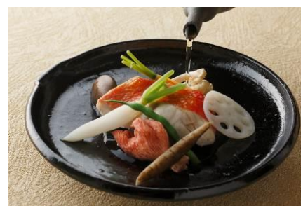
ランチコース「碧水」

メニュー / 料金 : ランチコース「碧水」 8,400 円 (全8品:旬の魚介と根菜の和風スープ仕立て含む) ディナーコース「洗」 21,000 円 (全8品:鮮魚とズワイ蟹のしゃぶしゃぶ、白子の鉄板焼含む)