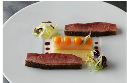
シャラン産鴨肉のロースト ミックススパイスの香り 大根のマリネとバターナッツ マスカルポーネ風味のポレンタ 赤ワインのシュック 7,300円

提供店舗 :6F フランス料理「クラウン」 提供期間 :2013年12月1日(日)～2014年2月28日(金) 提供時間 :ランチコース 11:30～14:00 ディナーコース 17:30～21:30 お問い合わせ :03-3211-5317