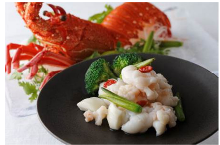
伊勢エビとココの実、百合根の炒め 金針菜添え(2人前) 3,637円

提供店舗 : 6F 中国料理「琥珀宮」 提供期間 : 2013年12月1日(日)～2014年2月28日(金) 提供時間 : ランチ 11:30～14:30 ディナー 17:30～22:00 お問い合わせ : 03-5221-7788