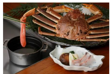
ディナーコース「洗」