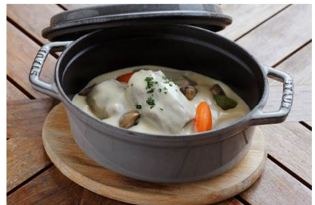
仔牛肉と季節野菜の煮込み フォアグラバターを加えて 3,300円