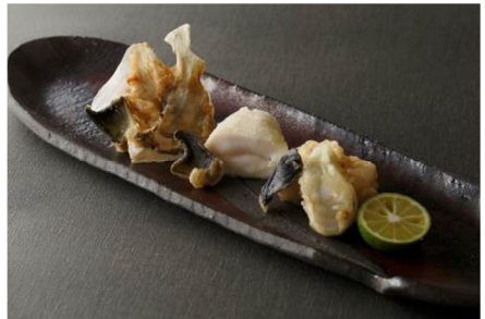
ディナーコース「さくら」16,800 円 (天麩羅 9 品: 天然虎河豚の天麩羅含む)