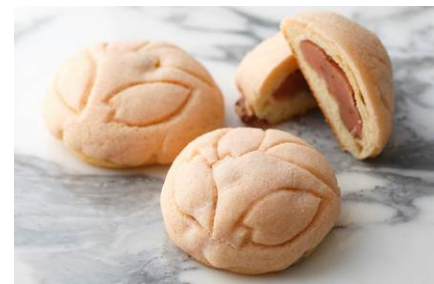
さくらめろんぱん