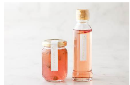
桜のコンフィチュール (左)、桜のハニーシロップ (右)

*価格はすべて消費税込です。 *4月1日(火)以降は消費税増税に伴い、料金に変更となります。