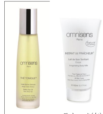
テ・トニック(左) アンスタン・ドゥ・フレッシュール(右)

軽やかでフレッシュなグリーンティーとベルガモットの香り。無着色、ノンパラベン、ノンシリコン、ミネラルオイル不使用で、高保湿でありながら、さっぱりと心地よい肌触りのボディクリーム。