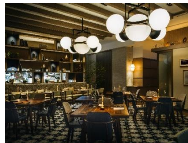
「UPSTAIRZ Lounge, Bar, Restaurant」