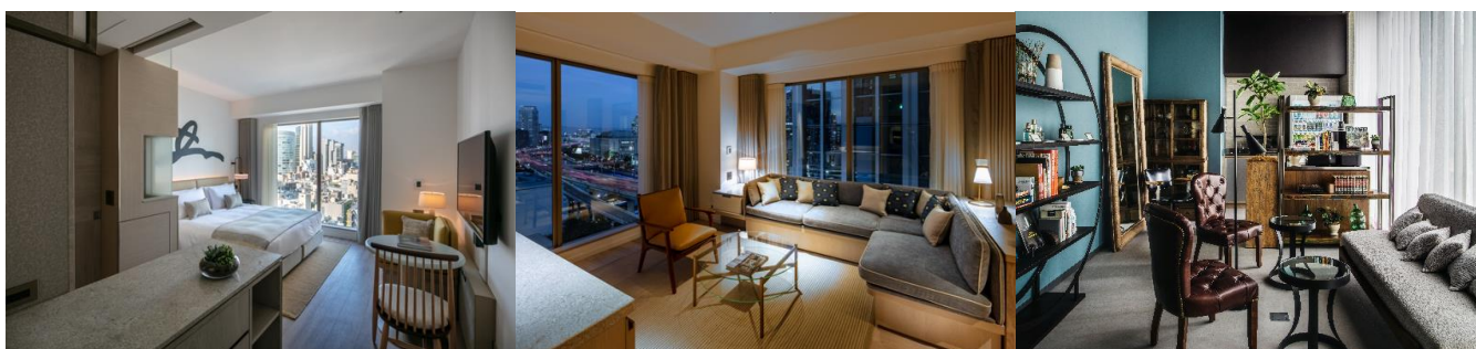
必要な機能がそろった客室 Studio (25㎡)