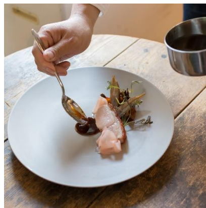
ディナーイメージ