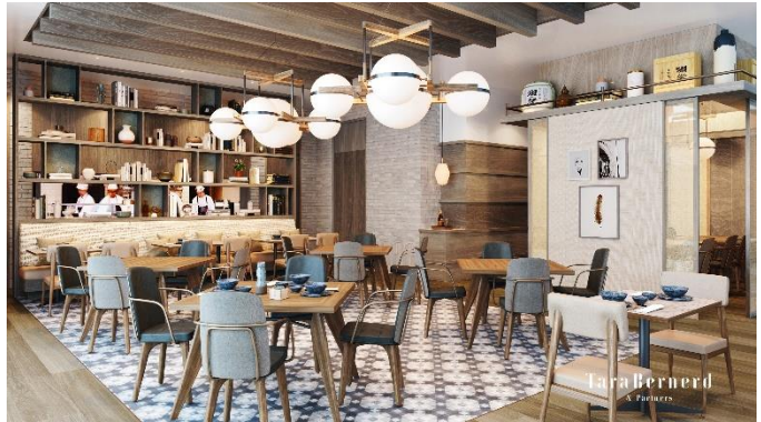
レストラン&バーラウンジ「UPSTAIRZ」イメージ

予約受付 : TEL 06-4796-3200 席数 : 116 席 (レストラン 54 席(個室 1 室 8 席含む)、 バーラウンジ 38 席、テラス 24 席) 営業時間 : <レストラン> ブレイクファスト 7:00 am~10:00 am ランチ 11:30 am~3:00 pm (2:00 pm L.O.) ディナー 5:30 pm~11:00 pm (10:00 pm L.O.) <バーラウンジ> カフェラウンジ 10:00 am~midnight (11:00 pm L.O.) バーカウンター 2:00 pm~midnight (11:30 pm L.O.)