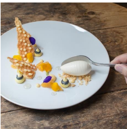
デザートイメージ