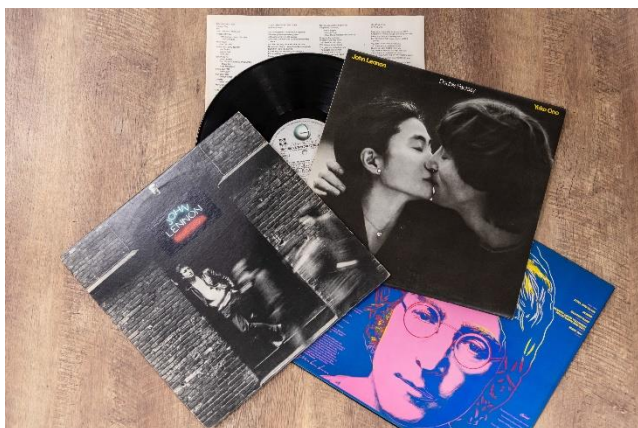
ジョン・レノン イメージ