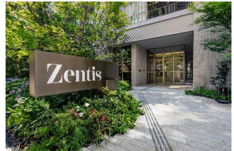
Zentis Osaka 外観