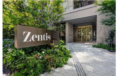
Zentis Osaka 外観