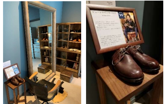
シューシャインコーナー