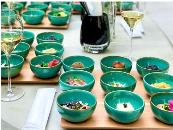
ガーデンビアタパス