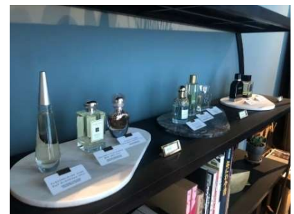
フレグランスバー