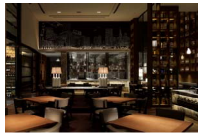
1F「グランド キッチン」