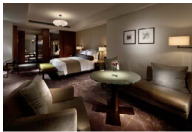
グランドデラックス 55㎡