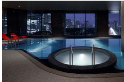
エビアン スパ 東京 屋内プール