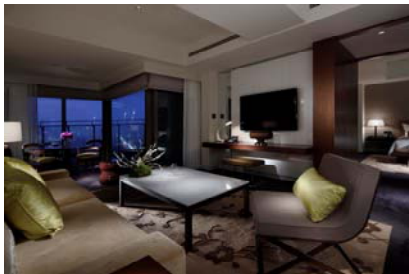
エグゼクティブスイート 75㎡