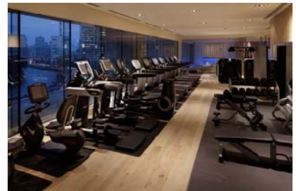
エビアン スパ 東京 フィットネスルーム