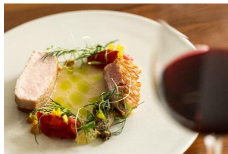
鹿児島県産 黒豚のロースト ～プッタネスカをフランス料理の解釈で～

肉料理には「鹿児島県産 黒豚のロースト～プッタネスカをフランス料理の解釈で～」。モディリアーニの故郷・イタリアと、彼の最期の地・フランスを繋ぐように、ピリッとした辛さが特徴のイタリア料理 プッタネスカの刺激的な味わいをフランス料理の手法で解釈し、さらに鹿児島県産黒豚を使うことで進化を遂げた一皿です。ペアリングの赤ワインは、パワフルでありながらもドライマトのような甘味、そしてそれをしっかりと支える厚みのある酸を感じさせ、料理の旨味をさらに引き立てます。