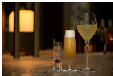
コラボレーションカクテル (右) White Elixir (左) Almond Eyes

晩年は大量の飲酒により退廃的な生活を送ったと伝えられるモディリアーニ。それは長年患っていた肺結核による咳を抑えるためであったともいわれます。その彼が愛したお酒の一つアブサンを使った、「死者を蘇らせるもの」「命果ててもなお愛し続ける」という意味も持つクラシックカクテル「Corpse Reviver」をロングスタイルにツイスト。大阪・中之島に蘇るモディリアーニ、そして彼を愛し続けた恋人ジャンヌに想いを馳せながら楽しまれては。