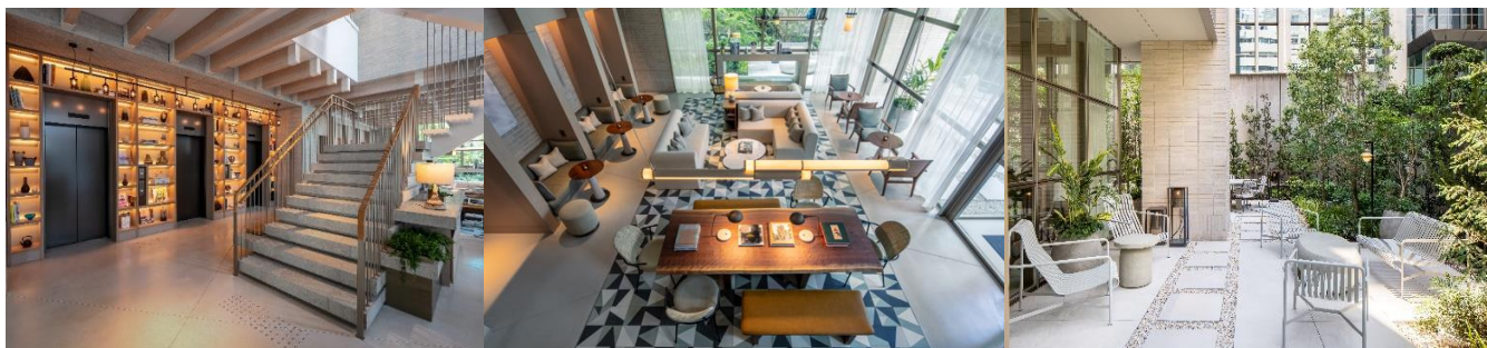
ロビー 正面の2階へ続く階段