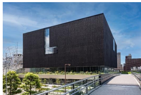
大阪中之島美術館

2022年2月2日、水都のシンボルである大阪・中之島に誕生した新しい美術館、大阪中之島美術館の開館を記念する展覧会として開館記念特別展「モディリアーニ-愛と創作に捧げた 35年-」を開催。イタリア出身のアメデオ・モディリアーニ (1884-1920) はフランスに渡り、エコール・ド・パリの一員としてピカソや藤田嗣治などと共に活躍。モディリアーニによる人物像はアーモンド形の眼や細長い首をもち、内面的な本質を鋭く捉えます。わずか35歳で命尽きるまで精力的に描いた作品群は、世界中で今なお愛好されています。本展では、国内外で所蔵されるモディリアーニ作品を中心に、同時代のパリを拠点に繰り広げられた新しい動向や多様な芸術の土壌を示し、モディリアーニ芸術が成立する軌跡をたどります。