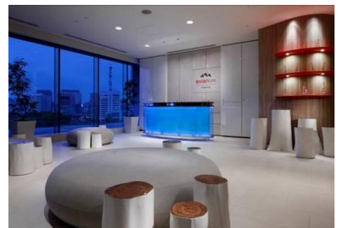
スパレセプション

フランスの「エビアン・リゾート」にあるデスティネーションスパをパレスホテル東京でご体験いただけます。“Luxury escape to wellness”（上質なウエルネスライフ）をコンセプトとし、ユニークなトリートメントを展開。フランスの洗練と東洋の技術を融合させた、仏“Evian Resort”のオリジナルスパメニューをベースに、都会のライフスタイルに合わせて特別にカスタマイズしたトリートメントをご用意。スパトリートメントは、宿泊のお客様だけでなく、ビジターのお客様にもご利用いただけます。