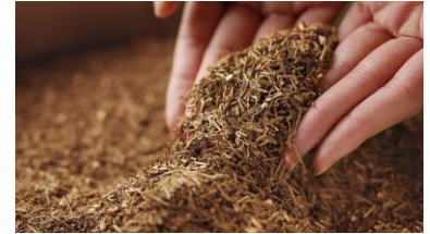
国産天然成分配合「warew」

日本の美を極める「warew」の製品を使用したフェイシャルトリートメント。ウメ根エキス、アカマツ葉エキス、ヤマザクラ樹皮エキス、ホオノキ樹皮エキスの4種の生薬由来成分を有効に働く黄金比で配合し、肌のハリや艶、輝きなどの*エイジングケア効果をもたらします。