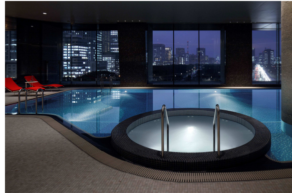
5F「エビアン スパ 東京」屋内プール