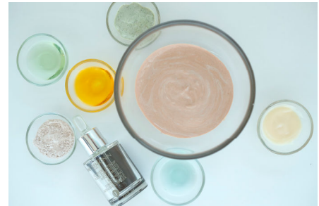
オプション用 スパ プロダクト イメージ

デトックスを高めてくれる天然のミネラルソルトスクラブで、 背中を心地よく刺激しながら、肌を滑らかにします。