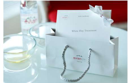
ホワイトデー トリートメントギフト券