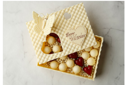
コフレ・ド・ショコラ

純白の蝶が美しい宝石箱にとまって羽を休める様子を模したアートショコラです。ホワイトチョコレートで作られた宝石箱の中には、真っ赤なハートのボンボンショコラやロドけなめらかなホワイトトリュフが収められています。