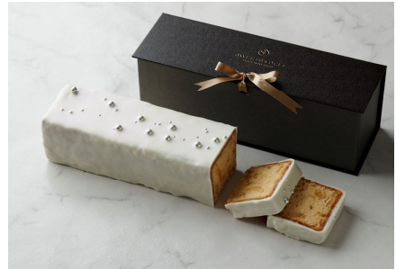
ケーク・オウ・シトロン

生地に混ぜ合わせたレモンコンフィの爽やかな酸味と濃厚なホワイトチョコレートが優雅なハーモニーを奏でるパウンドケーキ。凛とした美しい見た目だけでなく、口溶けとともに残る清々しいシトラスの余韻で、心も舌も満たしてくれます。