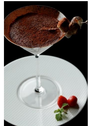
チョコレートマティーニ

チョコレートリキュール、クリームリキュール、ヴァローナショコラ、フレッシュクリームを使った、濃厚で滑らかな味わいのカクテル。仕上げには目の前でチョコレートを削り、特別感を演出。カルヴァドスで軽くフランベした苺をカクテルのサイドに盛り付けました。