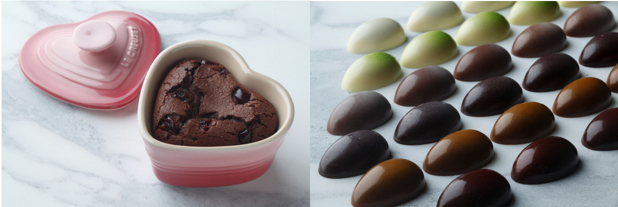
(ラムカン・ダムール テリーヌ・ショコラ)