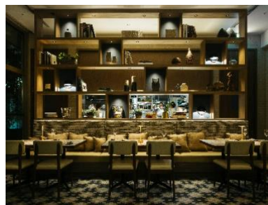
UPSTAIRZ Lounge, Bar, Restaurant