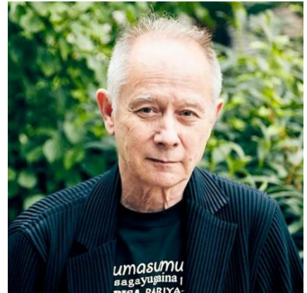
ピーター・バラカン氏

初めにブルーズがあった。ブルーズがなければロックンロールも、ソウルも、ジャズもなかったはずです。僕らの世代が若者だった頃には、大体ローリング・ストーンズなどの影響で、彼らが深い影響を受けたR&Bやブルーズに興味を持ちました。今やすっかり過去の音楽のように思われているブルーズは、実はタイムレスな重要文化財です。