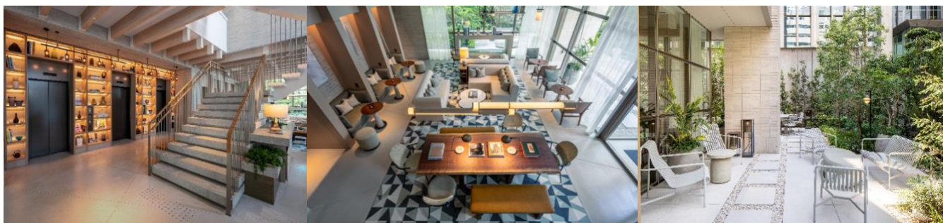
ロビー 正面には2階へ続く階段