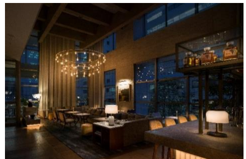
UPSTAIRZ Lounge, Bar, Restaurant

東京・中目黒「CRAFTALE」のエグゼクティブシェフ・大土橋 真也氏がプロデュースを行う同店にて、大阪の食文化に敬意を払い、五感に響く料理の数々をご提供いたします。